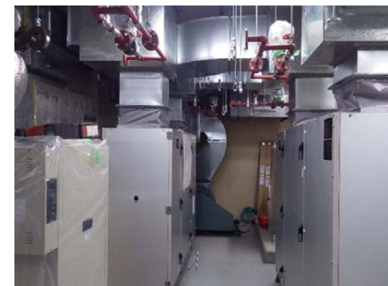
空気調和設備改修後