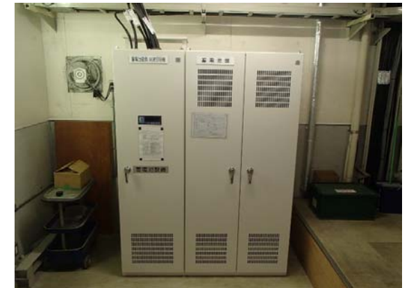
直流電源設備更新後