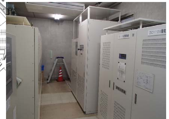
停電電源設備更新後