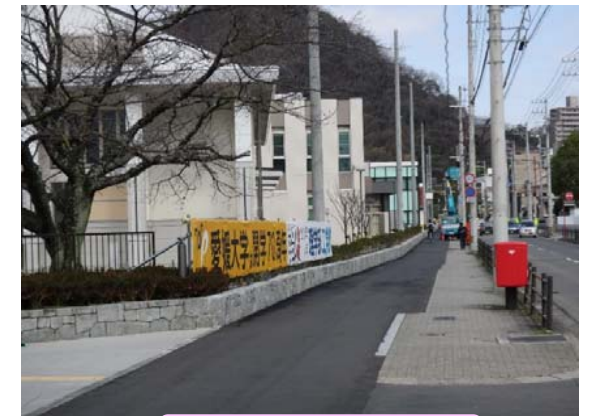
囲障改修(歩道拡張)後