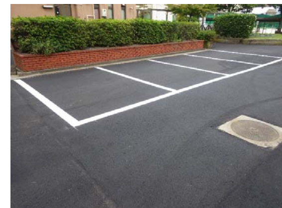
農学部会館西側舗装改修後