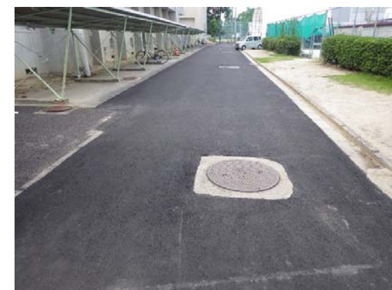
附属高校体育館西側改修後