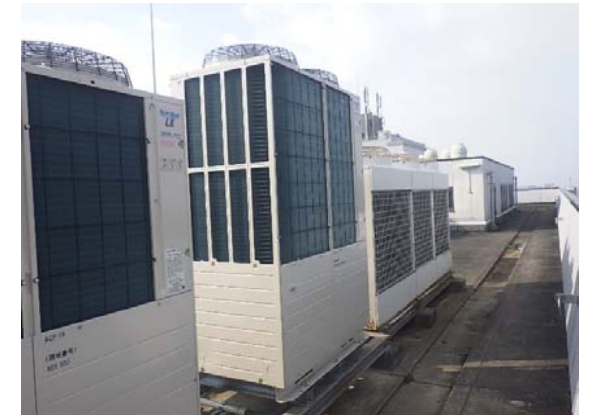
屋上室外機改修後