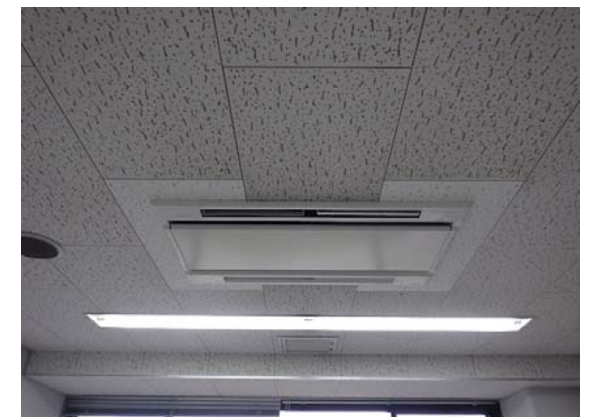
室内空調機改修後