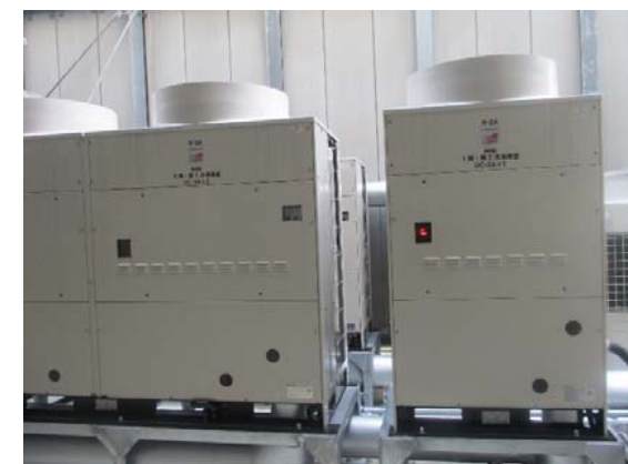
冷凍機(室外)更新 完成