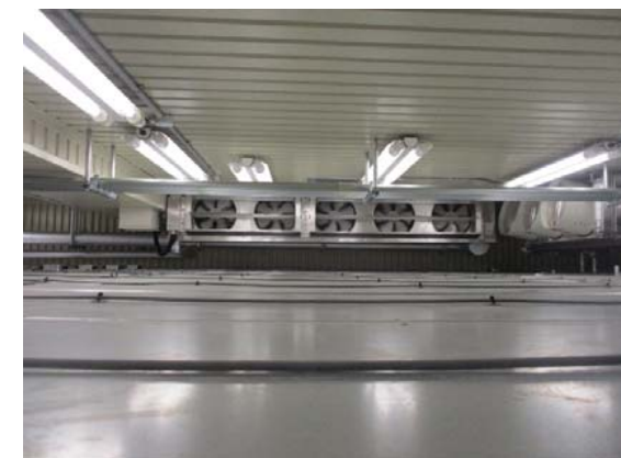
冷凍機(室内)更新 完成