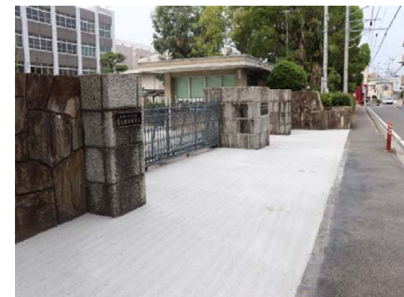
正門前舗装改修 完成