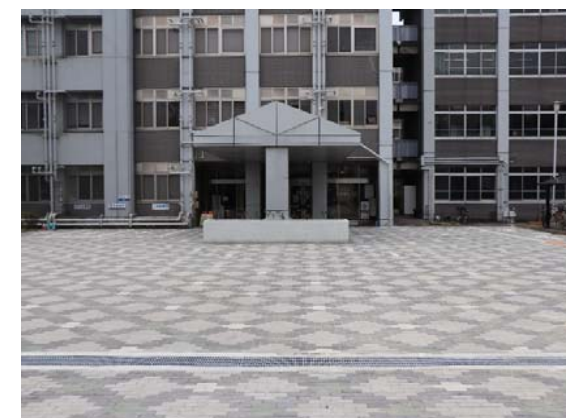
正門前舗装改修 完成