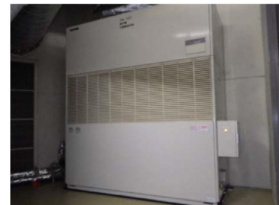
空調機(室内)更新 完成