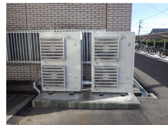
空調機(室外)更新 完成