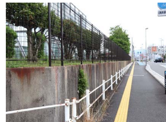
外周フェンス①更新 完成