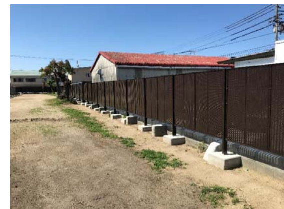
外周フェンス②更新 完成