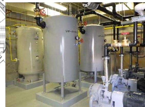
医療ガス設備更新 完成