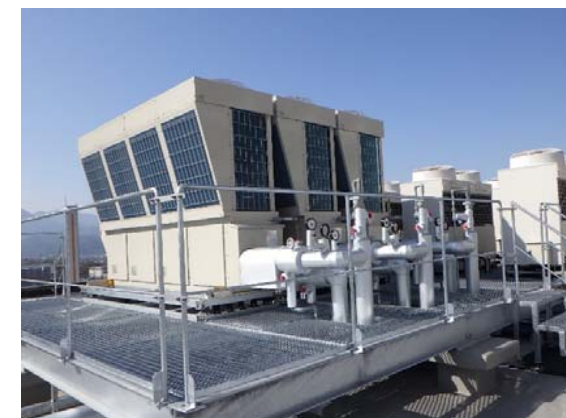
空気調和設備更新 完成