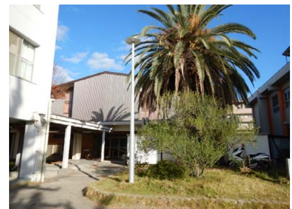
(持田)外灯更新 完成