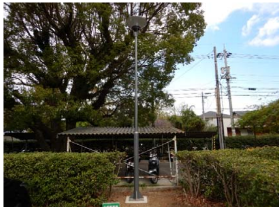
(樽味)外灯更新 完成