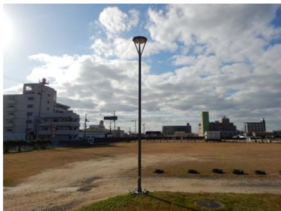
(山越)外灯更新 完成