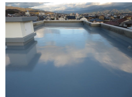
国際交流会館 完成