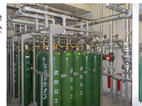
CO2消火設備更新 改修前