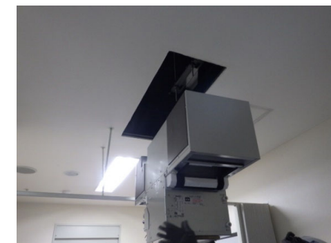
空気調和設備更新 施工中