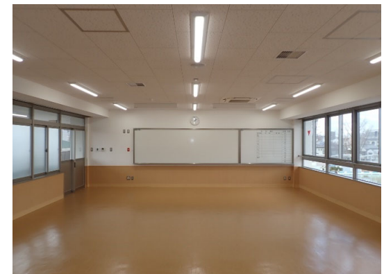
本館内部改修完成