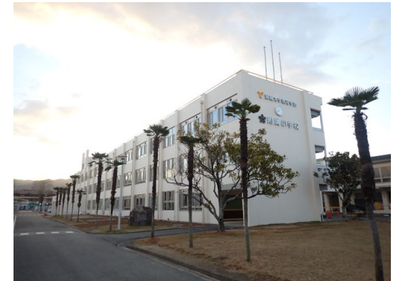
本館外部改修完成