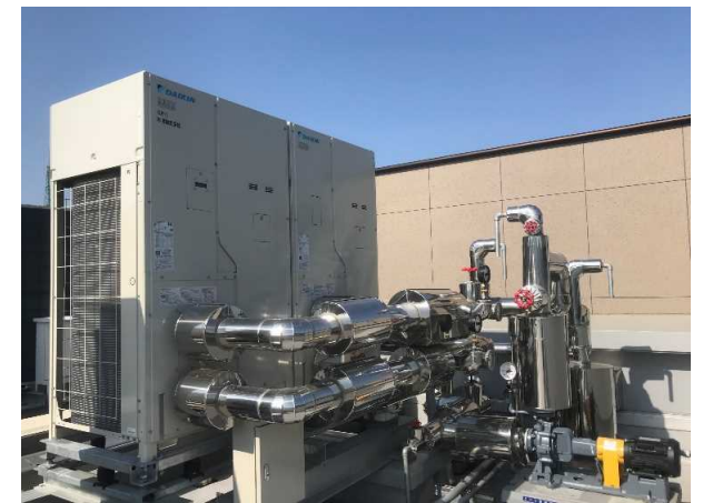
空気調和設備 室外機 完成