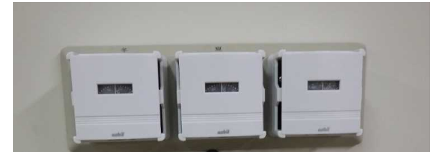
自動制御設備 完成