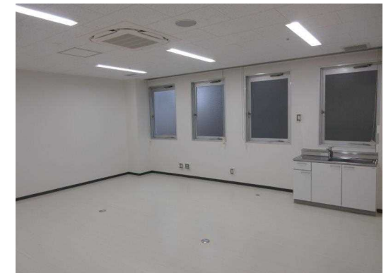
臨床研究支援センター 内部改修 完成