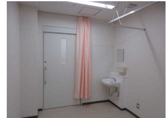
乳腺センター 内部改修 完成