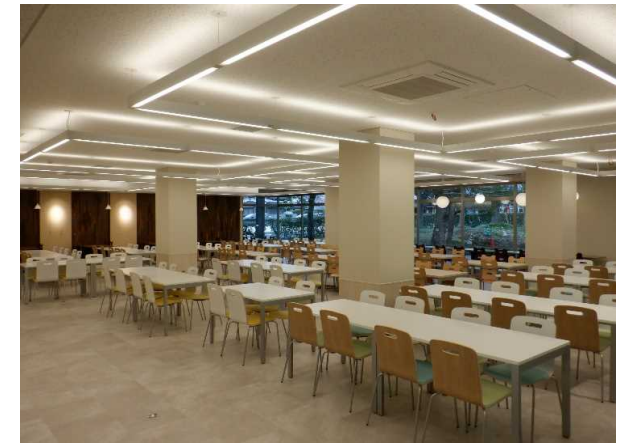
農学部会館 食堂 完成