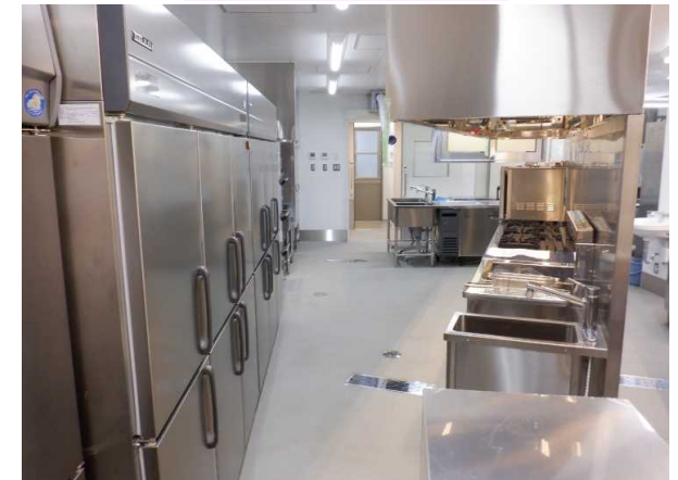
農学部会館 厨房 完成