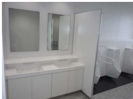
大学会館便所改修 完成