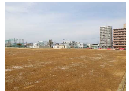
グラウンド整備 完成