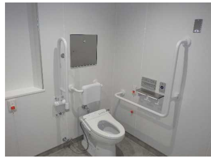
大学会館便所改修 完成