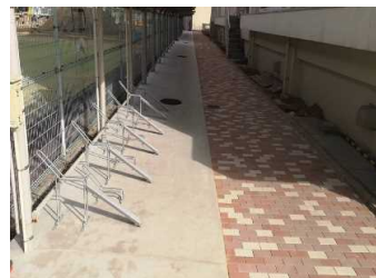
雨水・生活排水系統・外構 完成

樋又地区・文京町2番地区 屋外埋設配管改修 雨水排水系統 生活排水系統 薬品排水系統・検水槽 外構改修