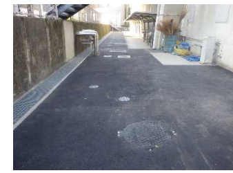
災害用汚水貯留槽 完成

樋又地区・文京町2番地区 屋外埋設配管改修 雨水排水系統 生活排水系統 薬品排水系統・検水槽 外構改修