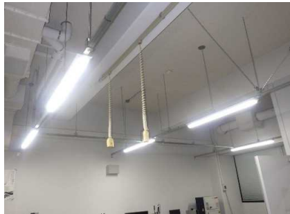
工学部1号館 照明設備 完成