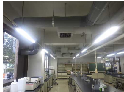
農学部3号館 照明設備 完成