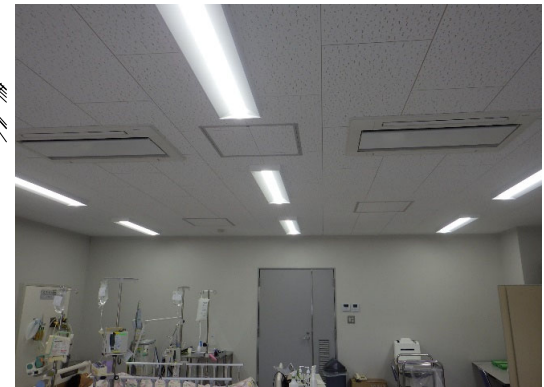
照明設備(研究室) 完成