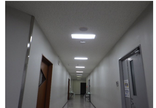
照明設備(廊下) 完成