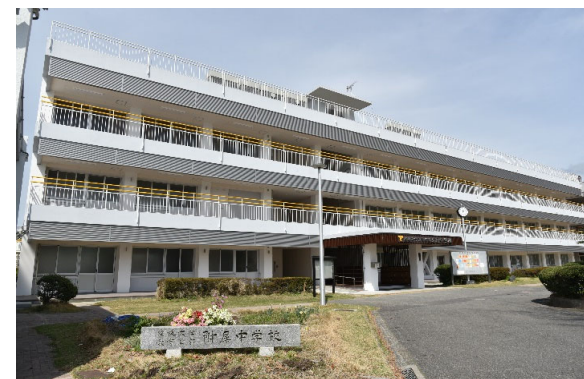
附属中学校本館外部改修 完成