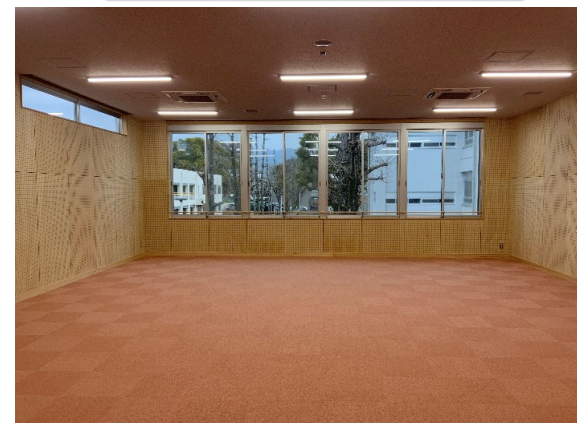
音楽教室内部改修 完成