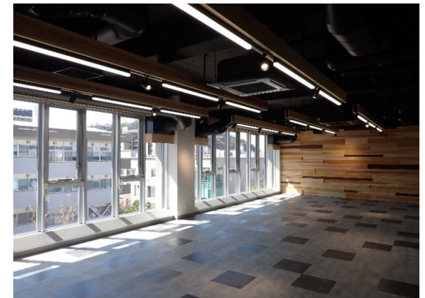
教育学部4号館内部改修 完成