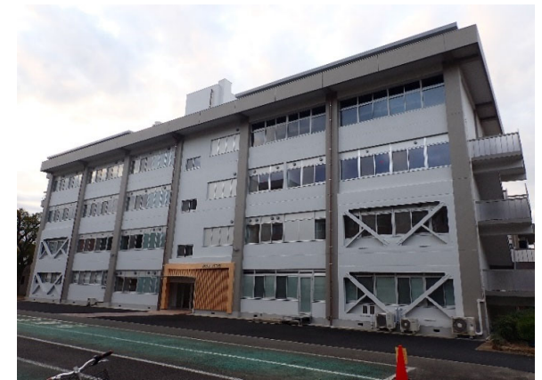
教育学部4号館外部改修 完成