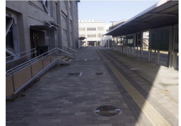
雨水・生活排水系棟・外構 完成