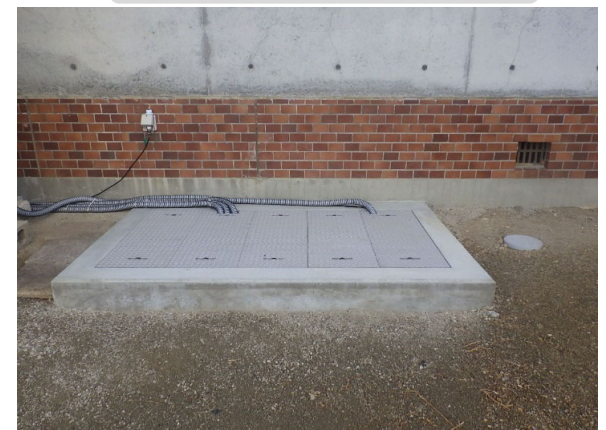
グリーストラップ 完成