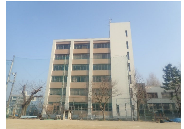
附属高校校舎4号棟外部改修 完成