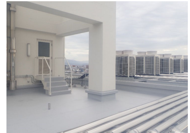
附属高校校舎4号棟屋上防水改修 完成