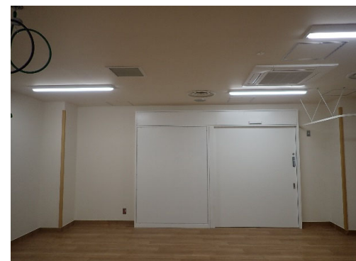
シンチカメラ室 内部改修完成