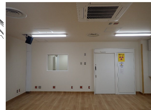
操作室 内部改修完成