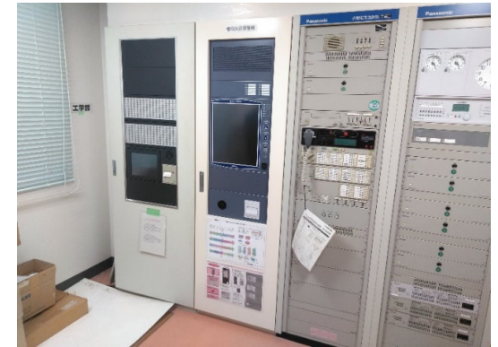
自動火災報知設備 (社会共創学部本館/総合研究棟2) 完成