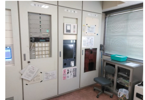
自動火災報知設備(理学部本館) 完成