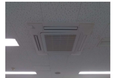
実験室 空調室内機