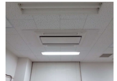
研究室 空調室内機

施設名 学術支援センター (遺伝子解析研究支援部門) 用途 大学教育・研究施設 構造・階数 R・4 延べ面積 1,760㎡ (改修面積: 537㎡) 設計 (株)富山設備設計 工事 三和ダイヤ工業(株)/愛和電設(株) 工期 令和5年9月 ~ 令和6年3月 (約6か月) 工事概要 中規模改修 (空調)