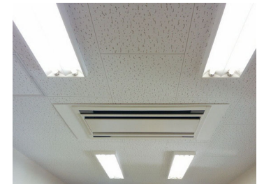
研究室 空調室内機

施設名 環境産業研究施設 用途 大学教育・研究施設 構造・階数 R・4 延べ面積 1,958㎡ (改修面積：674㎡) 設計 (株)富山設備設計 工事 三和ダイヤ工業(株)／西日本電設(株) 工期 令和4年12月～令和5年5月(約6か月) 工事概要 中規模改修(空調)