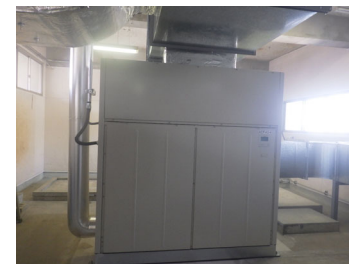
機械室 空調室内機