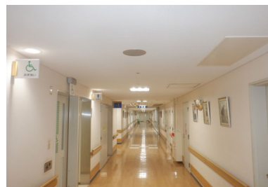
附属病院本館 照明

施設名 附属病院本館・附属病院2号館・立体駐車場 用途 附属病院・大学管理施設 構造・階数 SR・10-I、SR9-I、SI 延べ面積 45,824㎡、15,186㎡、3,131㎡ 設計 愛媛大学施設基盤部 工事 (有)白石電設 工期 令和5年9月～令和6年3月(約7か月) 工事概要 中規模改修(照明)