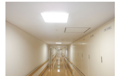
附属病院本館 照明