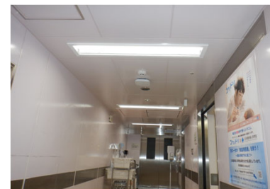
附属病院本館 照明