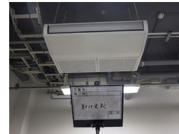
実験室 空調室内機