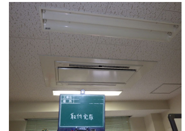
研究室 空調室内機