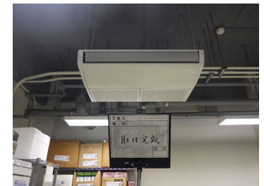
実験室 空調室内機

施設名 社会共創学部本館/総合研究棟 2 用途 大学教育・研究施設 構造・階数 R・4 延べ面積 9,176㎡（改修面積：251㎡） 設計 (株)富山設備設計 工事 (有)キョカワ商事 工期 令和5年5月～令和5年7月（約3か月） 工事概要 中規模改修（空調）